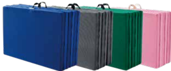
ブルー・ブラック ホワイト・ブラック グリーン・ブラック ピンク・ホワイト

シングル (97×198×11cm) 36,500円+税 セミダブル (117×198×11cm) 48,000円+税 ダブル (137×198×11cm) 59,000円+税 芯材: エリオセル(11cm) 側地: 立体構造のフライニット (ポリエステル95%、ポリウレタン5%)